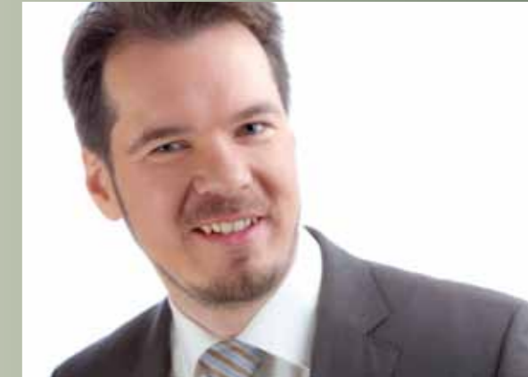
Foto: © P. Killick, Wiesbaden Weiteres Bildmaterial: www.photocase.com www.fotolia.de

Telefon: (0611) 58 53 218 Mobil: (0176) 54 732 133 Fax: (0611) 931 06 38 Mail: info@beratungspraxis-krug.de Internet: www.beratungspraxis-krug.de